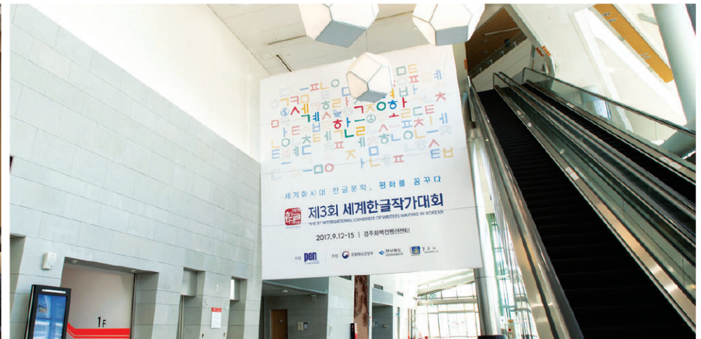
4 1층 로비 주령구 천정 현수막 5.7m(L)x4.8(H) (건타카, 스테이플러 사용)

※ 빔프로젝터 사용시 화면을 가리지 않는 제안 세로폭 1, 2층 회의실:70cm