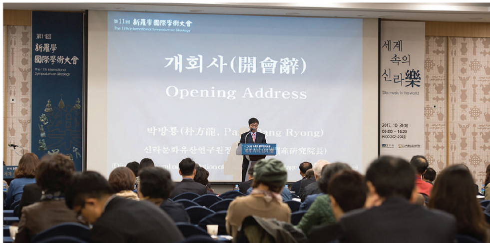
3 팽파레 현수막 0.9m(L)x3.7(H) (양면테이프, 각목 사용)