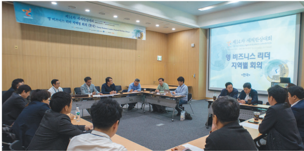
1 1층 회의실 현수막(101,104,106호) 5.7m(L)x0.7m(H) (건타카, 스테이플러 사용)