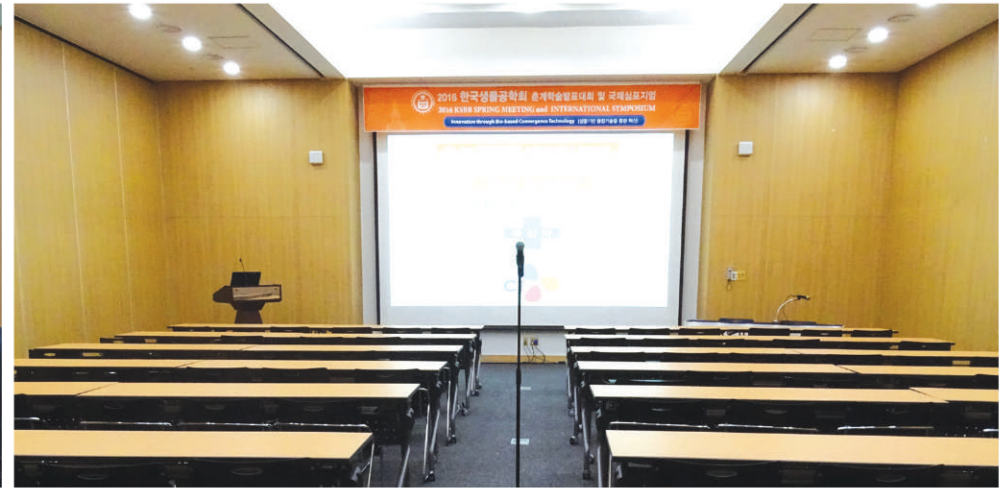
2 1층 회의실 현수막(102,103,105호) 4.6m(L)x0.6m(H) (건타카, 스테이플러 사용)