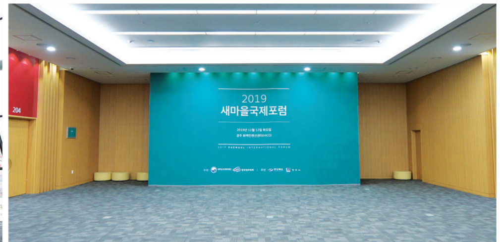
4 2층 회의실 라운지 백월 배너 7.9m(L)x4.5m(H)

※ 빔프로젝터 사용시 화면을 가리지 않는 제안 세로폭 1, 2층 회의실:70cm