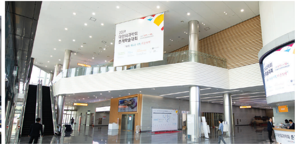
2 2층 로비 천정 현수막(GATE3) 5.7m(L)x4.8m(H) (건타카, 스테이플러 사용)