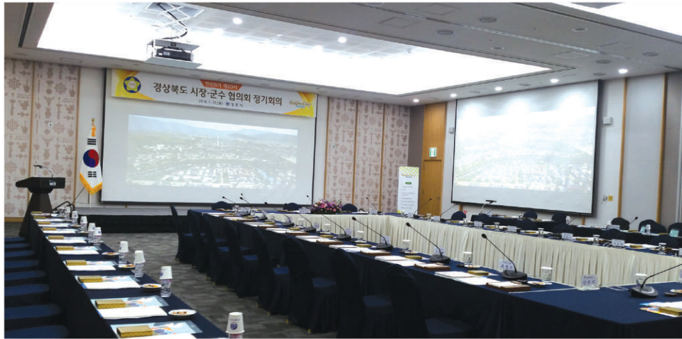
1 2층 회의실 현수막(201~206호) 5.7m(L)x0.7m(H) (건타카, 스테이플러 사용)